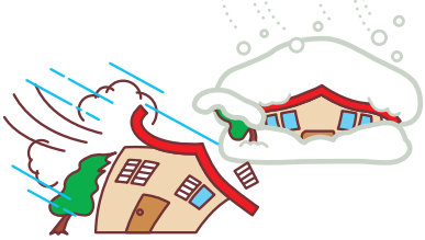
台風や大雪による被害